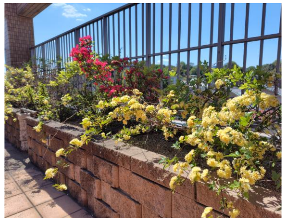
バルコニーにあるお花

特に、モッコウバラは“季節の風物詩”という名にふさわしく、鮮やかな黄色い花がたくさん咲きます。このモッコウバラは、支援センターの自慢のひとつとなっており、バルコニーに出てモッコウバラを鑑賞しながらコーヒーを楽しめる拡大版カフェプログラムを昨年より開催しており、今年も4/15に開催しました。5月は5/13、5/20に開催予定です。多くの皆様のご参加をお待ちしています!