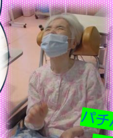
ハッピー ハッピー