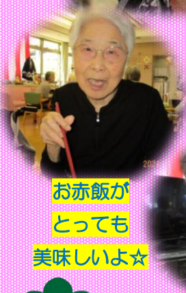
お赤飯が とっても 美味しいよ☆