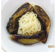
←副菜： 茄子のそうめん