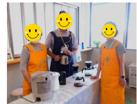
“コーヒーボランティアらんらん”の皆さん

参加した方から 「楽しかった」という感想をいただき、 「次はいつやるんですか?」「毎月開催して欲しい」と好評でした!!