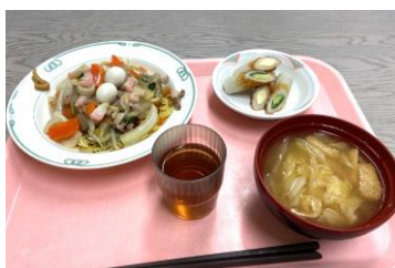
あんかけ焼きそば