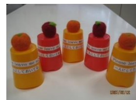
②一人にしておいてねサイン