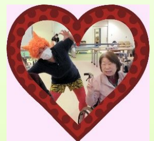
節分の日はりハビリ に、鬼 参上!