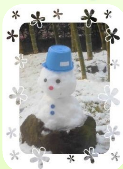
中庭にスノーマン登場!! 可愛いですね