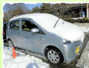
みんつば号も雪化粧